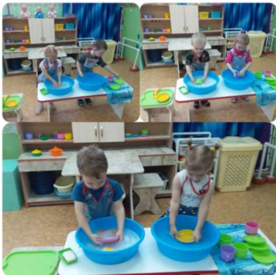
Моем кукольную посудку

Мальши увлечены несложным игровым сюжетом